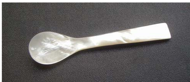
Cuillère service à caviar Longueur : 11.5, cm Référence : PACCU1150

Ici, vous trouverez la plus ancienne forme de cuillère à caviar : la palette à caviar encore appelée cuillère « en bec de canard ».