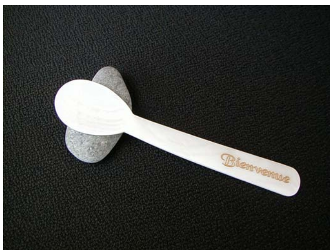
Exemple de gravure sur cuillère 11cm

Il est également possible de les personnaliser en incrustant dans le manche le logo en couleur de votre entreprise, sous réserve que le nombre de couverts commandés soit suffisant.