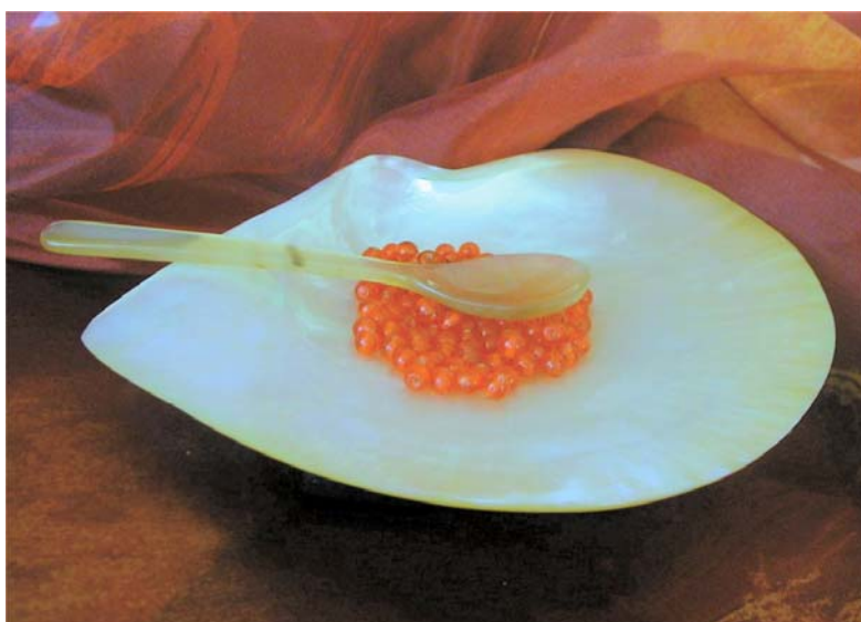
Assiette individuelle à caviar en nacre japonaise Diamètre : de 10 cm à 13 cm Référence : STPASJAP0911