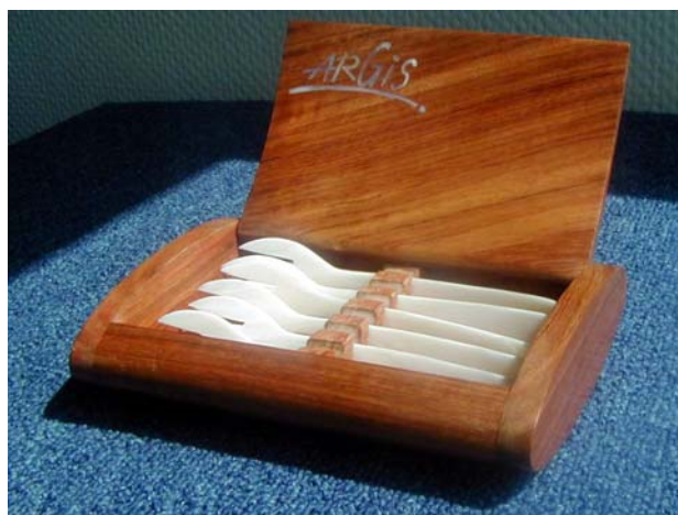
Coffret en bois massif

Notre flexibilité nous permet de personnaliser le coffret en y incrustant avec de la nacre votre logo, votre signature ou le nom de votre entreprise là où vous le souhaitez.