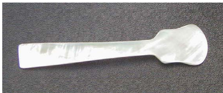
Cuillère service à caviar dite en « bec de canard » Longueur : 12.75 cm Référence : BELCU1275

Ici, vous trouverez la plus ancienne forme de cuillère à caviar : la palette à caviar encore appelée cuillère « en bec de canard ».