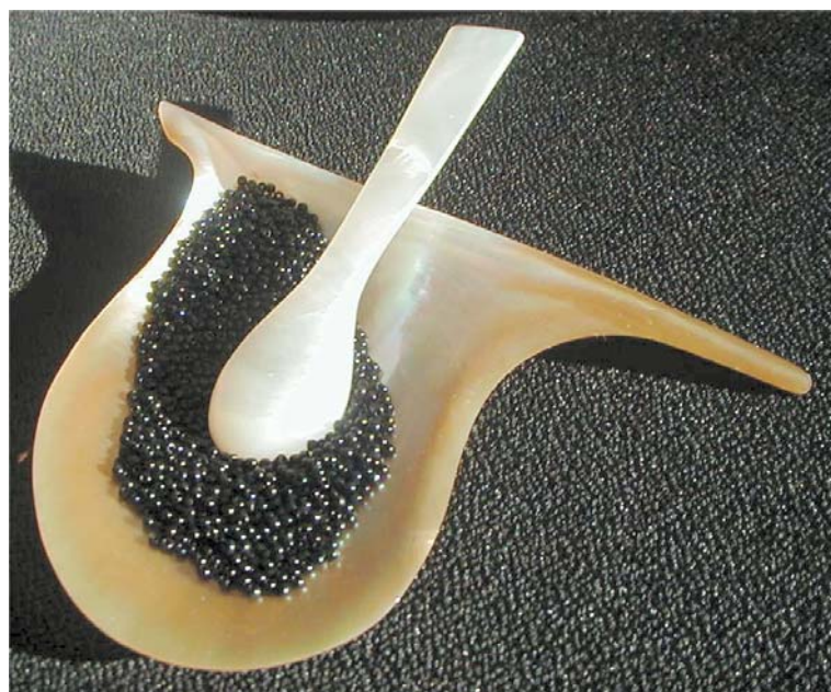
Assiette individuelle à caviar en nacre ambrée Diamètre : de 10 cm à 13 cm Référence : STPASAMB0911

Merci de noter que ces deux articles seront disponibles sur commande et sujet approvisionnement restreint.