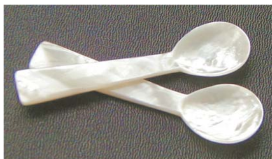
Cuillère dégustation à caviar Longueur : 10 cm ou Référence : PACCUP1000

Entièrement réalisée à partir de la nacre japonaise et spécialement conçue pour accompagner toute grande table, la collection Pacifica se compose des articles suivants :