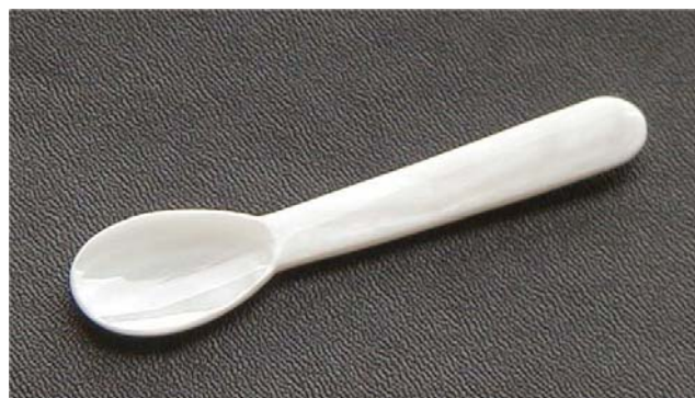
Cuillère de dégustation Longueur : 9 cm Référence : INFCU0900

Ces cuillères sont les plus appréciées par les grands comptes comme les compagnies aériennes, pour leurs classes affaires ou leurs premières classes. Ces deux cuillères seront également les compagnes idéales pour vos coffrets cadeaux pour toute grande occasion.