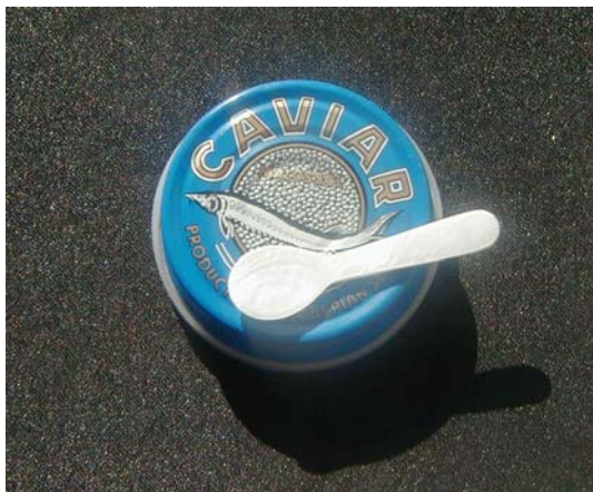
Cuillère de dégustation Longueur : 7 cm Référence : INFCU0700

Ces deux cuillères, sont idéales pour la dégustation du caviar et des œufs de poissons. Elles accompagneront à merveille verrines ou boîtes en métal de 50, 100 grammes